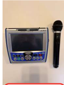
タブレット、マイク