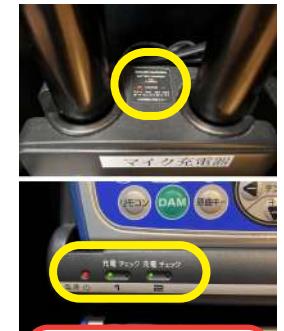
充電台の各ランプ （しっかり嵌め込んでください）

カラオケ終了後はタブレット、マイクは充電台へお戻しください。 お戻しの際は充電ランプ点灯をお確かめください。 （赤ランプ = 充電中 / 緑ランプ = 使用可能）