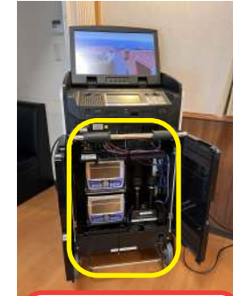
カラオケボックス本体